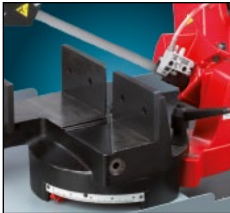
Morsa in ghisa con bloccaggio rapido completa di scorrimento veloce. Etau en fonte à blocage et glissement rapide.