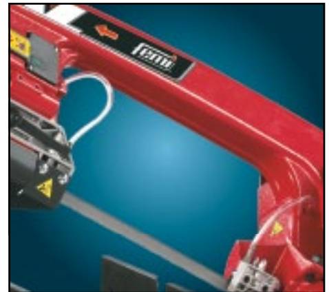
Robusta struttura in alluminio pressofuso. Structure solide en aluminium moulé.