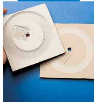
Abrasion Taber eseguita su Ultraplan (provino di destra) e rasatura convenzionale (provino di sinistra) dopo 200 giri