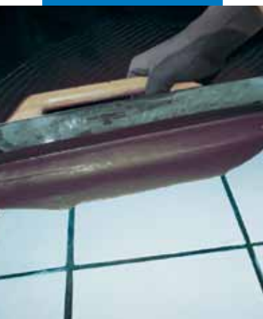
Stesura con spatola metallica di Ultraplan su pavimento esistente in ceramica previa applicazione di Mapeprim SP