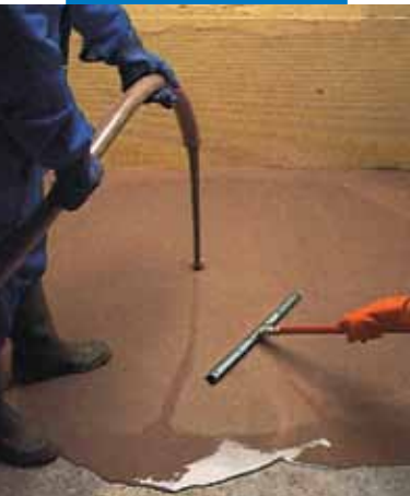
Applicazione di Ultraplan con pompa e successiva raclatura

Ultraplan può essere pulito, finché fresco, dalle mani e dagli attrezzi con acqua.