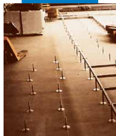
Soletta livellata con Ultraplan per messa in opera di pavimenti galleggianti