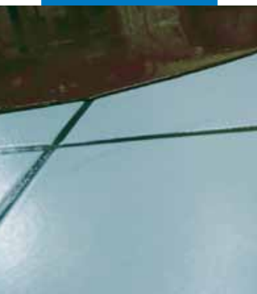
Particolare dell'applicazione di Ultraplan su pavimento in ceramica esistente previa applicazione di Mapeprim SP