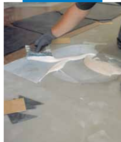
Esempio di posa di PVC (a intarsio) su lisciatura in Ultraplan - CD 2 - Milano - Italia