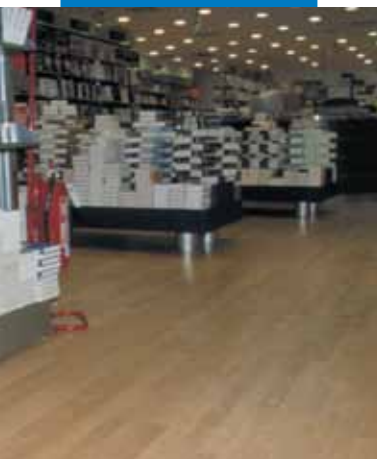
Esempio di posa di legno effettuata su livellatura in Ultraplan - Messagerie Musicali - Roma - Italia