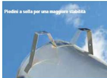
Per serbatoi orizzontali fino a lt. 2000