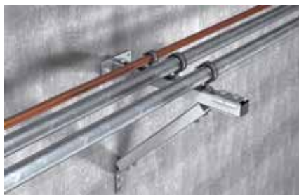
Installazione su mensola