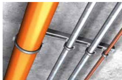
Fissaggio tubazioni a soffitto