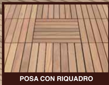
POSA CON RIQUADRO