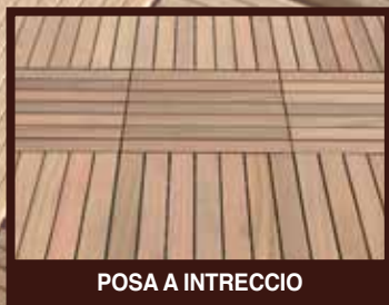
POSA A INTRECCIO