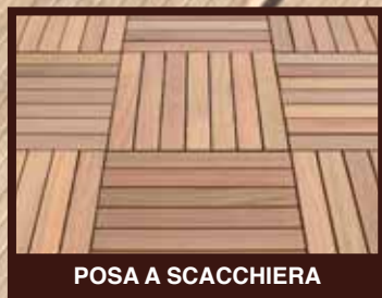
POSA A SCACCHIERA