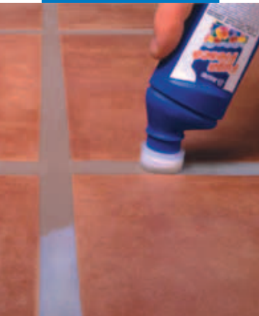
Trattamento con Fuga Fresca su pavimento in cotto