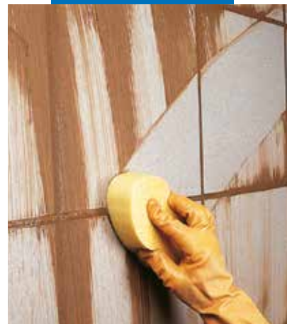
Finitura di parete con spugna

I contenuti della presente Scheda Tecnica possono essere riprodotti