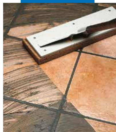
Pulizia di monocottura con spazzolone di spugna