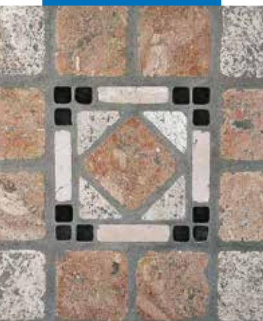
Esempio di stuccatura di pavimento anticato in pietra naturale

Le referenze relative a questo prodotto sono disponibili su richiesta e sul sito Mapei www.mapei.it e www.mapei.com