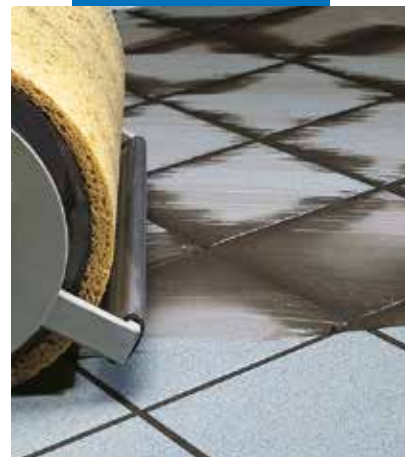
Finitura a pavimento con macchina