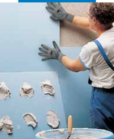
Posa di lastre di polistirolo con Keraflex bianco