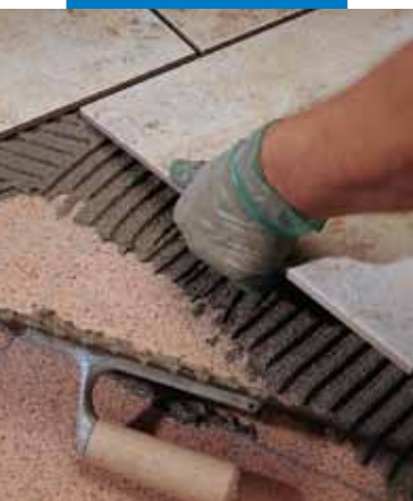
Sovrapposizione di un rivestimento in monocottura su marmette esistenti

– membrane impermeabilizzanti in Mapelastic o Mapegum WPS .