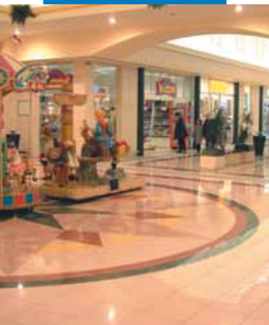
Esempio di posa di grès porcellanato - Centro Commerciale Zanchetta - Treviso