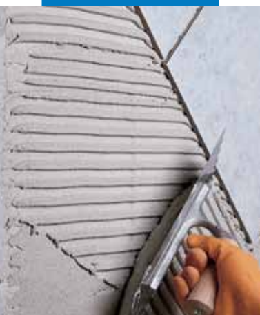
Posa di monocottura su parete in blocchi di cemento cellulare espanso