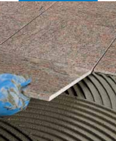
Posa di marmo prelevigato a pavimento