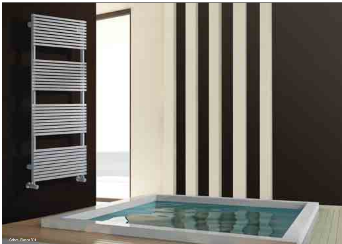
Colore: Bianco R01