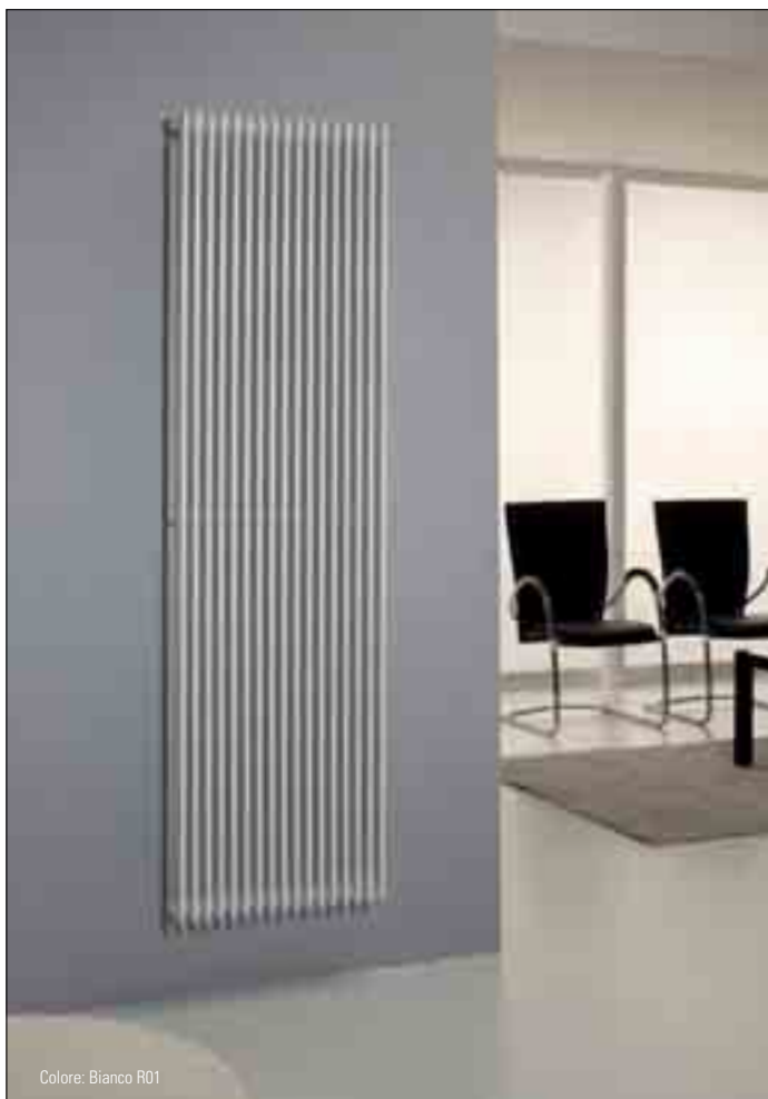
Colore: Bianco R01