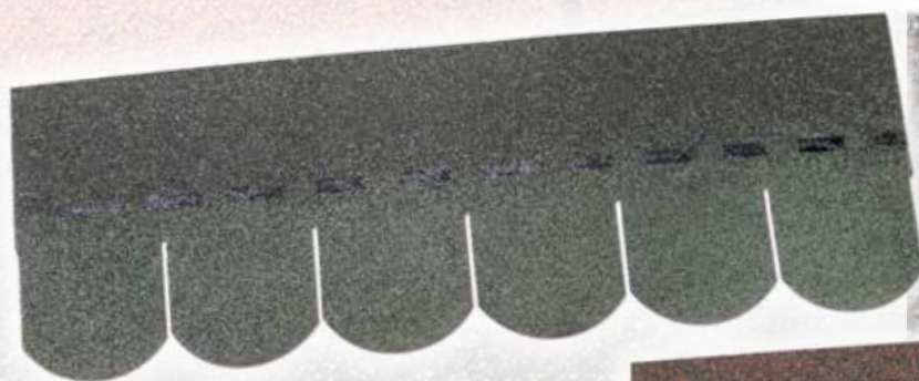
Polytegola N coda di castoro