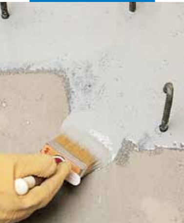
Applicazione di Eporip a pennello per ripresa di getto