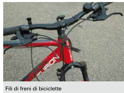
Fili di freni di biciclette