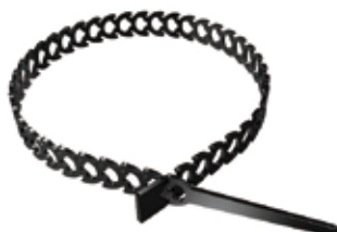
Fissaggio flessibile FLEXI-FIX R